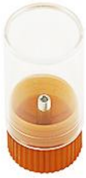
EM-Tec SH1 M4 シングルスタブ保存容器 15mm φ M4 スタブ用